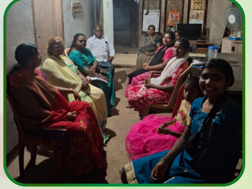
ஏற்றக்கோடு அன்பியம் - 3