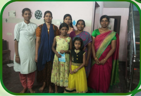
சூசைபுரம் அன்பியம் 9