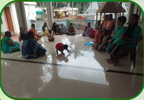
தொலையாவட்டம் அன்பியம் - 2