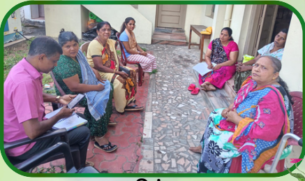
மணலிக்கரை அன்பியம் 4