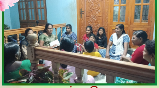
காரங்காடு அன்பியம் 9