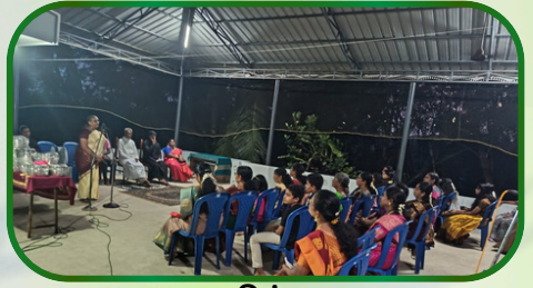
மணலிக்கரை அன்பியம் 5 (ஆண்டு விழா)