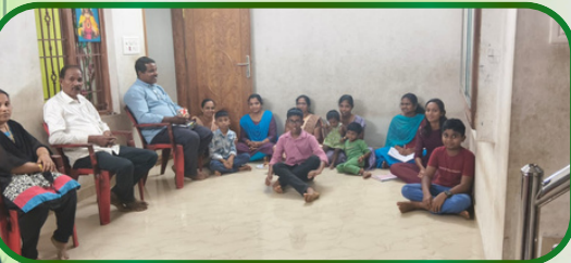
கரும்பிலாவிளை அன்பியம் 4