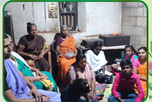
குலசேகரம் அன்பியம் - 1