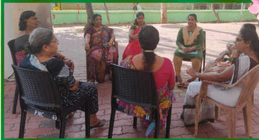
திருவிதாங்கோடு அன்பியம் 6