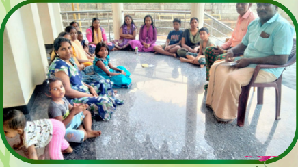
இளம்பிலாவிளை அன்பியம் 4