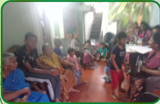
அம்பலக்கடை அன்பியம் - 2