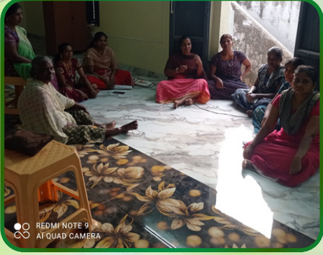
ஆற்றூர் அன்பியம் - 5