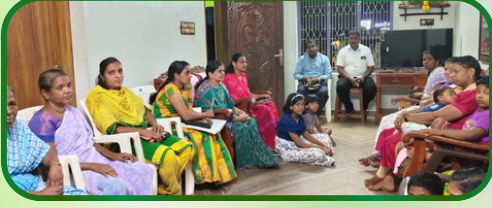
முஞ்சிறை அன்பியம் 12