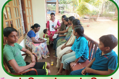
கம்பிளார் அன்பியம் -5