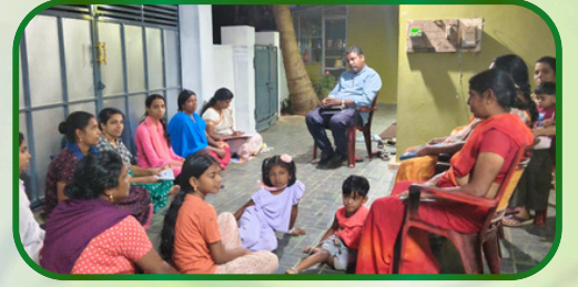
கரும்பிலாவிளை அன்பியம் 3