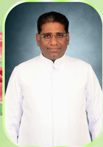
அருள்பணி. W. ஓய்சிலின் சேவியர் திரித்துவபுரம்