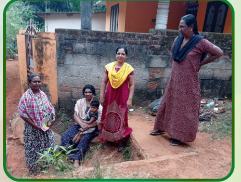
அம்பலக்கடை அன்பியம் - 3