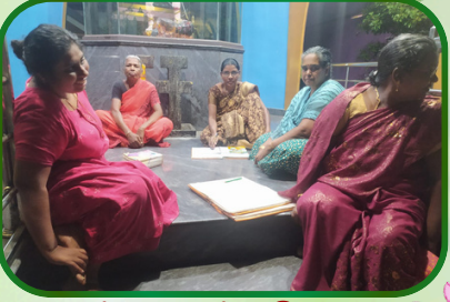
கண்ணன்விளை அன்பியம் - 2