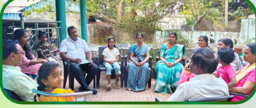
காப்புக்காடு அன்பியம் 8