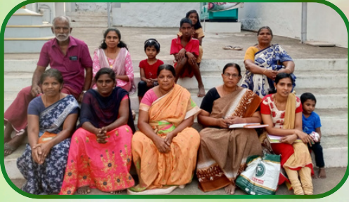
நெல்லிக்காவிளை அன்பியம் 1