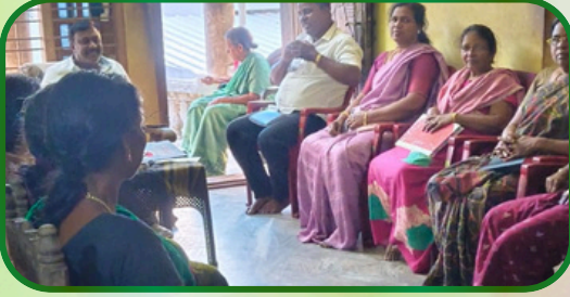
காப்புக்காடு அன்பியம் 10