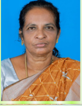
K. மரிய ரெத்தின பாய் தலைவர்