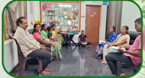
மணலிக்கரை அன்பியம் 21