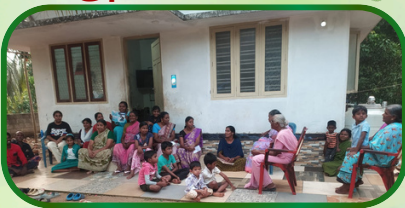
கம்பிளார் அன்பியம் -7