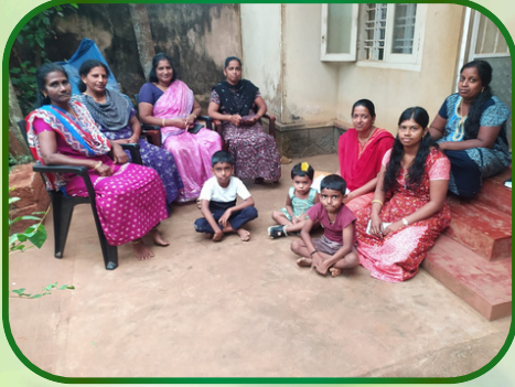
தொலையாவட்டம் அன்பியம் - 2