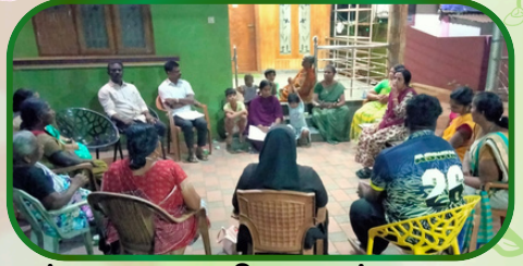
தக்கலை, புனித குழந்தை தெரசாள் அன்பியம்