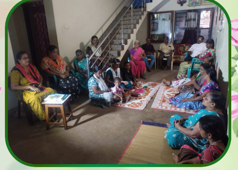
பள்ளியாடி அன்பியம் - 16