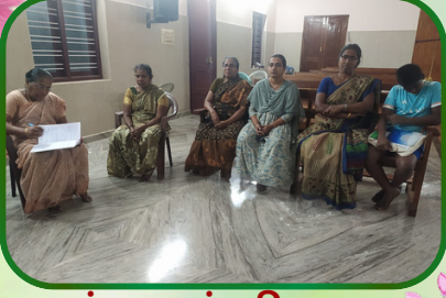
கண்ணன்விளை அன்பியம் - 1