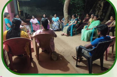
கம்பிளார் அன்பியம் -2