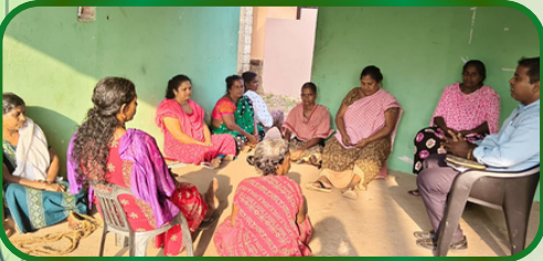
விளாத்துறை அன்பியம் 3