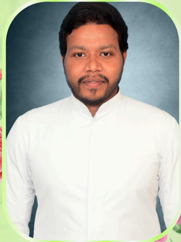
அருள்பணி. பெர்டின் அனஸ் வேங்கோடு