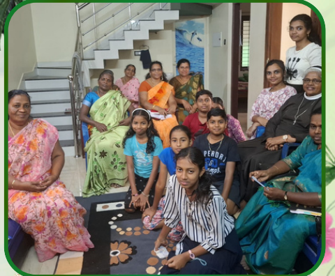
ஏற்றக்கோடு அன்பியம் - 2