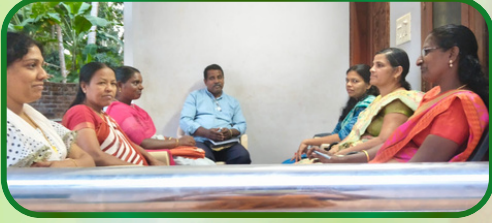
முஞ்சிறை அன்பியம் 15