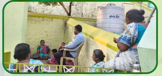
விளாத்துறை அன்பியம் 1