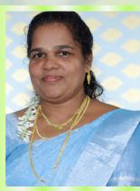
ஃப்ளோரிடா மேரி பொருளர்