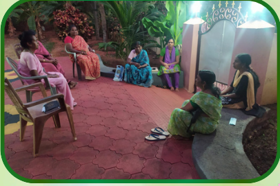
கம்பிளார் அன்பியம் -1