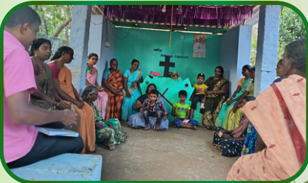
மணலிக்கரை அன்பியம் 19