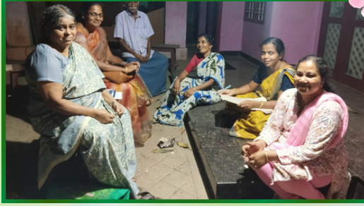
கண்டன்விளை அன்பியம் 3