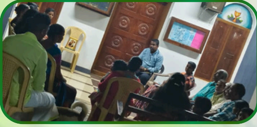
கரும்பிலாவிளை அன்பியம் 2