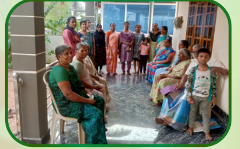
சிராயன்குழி அன்பியம் 6