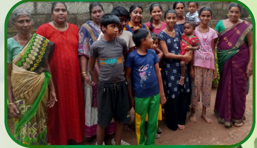
சிராயன்குழி அன்பியம் 1