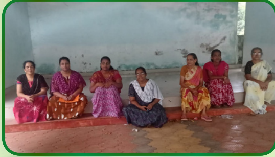
அம்பலக்கடை அன்பியம் - 2