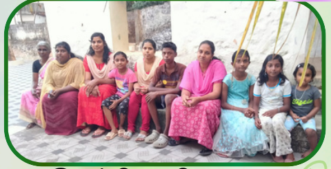
இளம்பிலாவிளை அன்பியம் 1