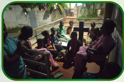
கம்பிளார் அன்பியம் -7