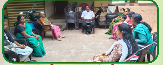
முஞ்சிறை அன்பியம் 8