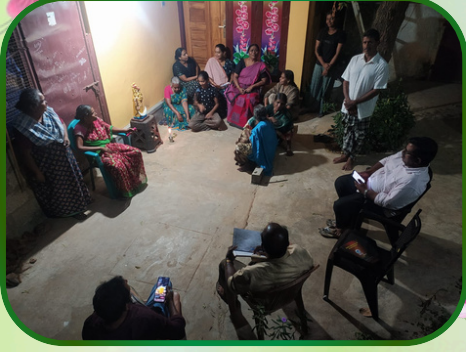
பள்ளியாடி அன்பியம் - 18