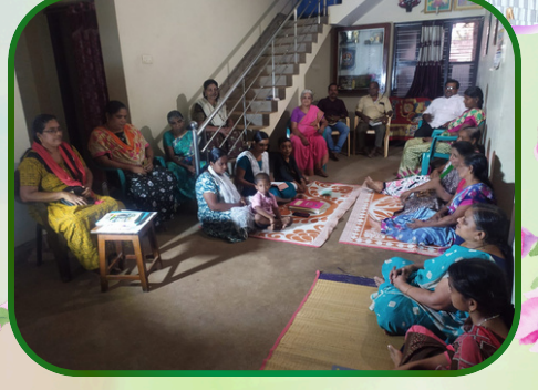
துண்டத்துவிளை அன்பியம் - 15