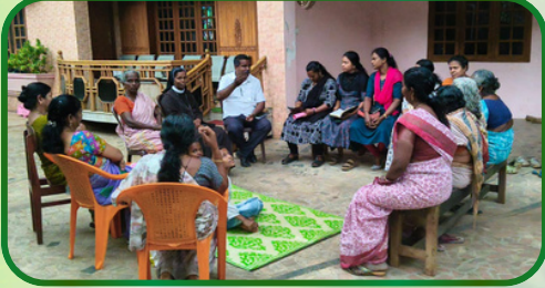
வாவறை அன்பியம் 2