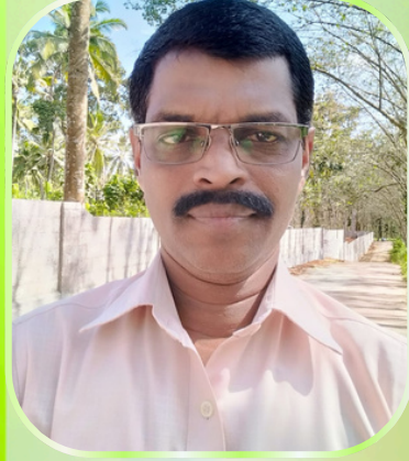
S. ஜாண் பெல்லார்மின்