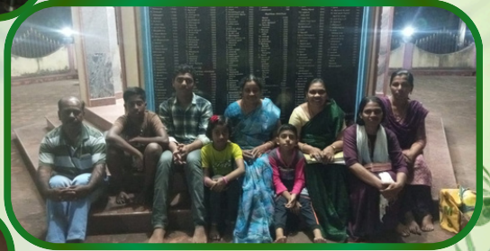
களியக்காவிளை அன்பியம் 10