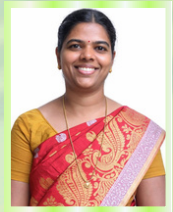
G.M. செல்லர் செயலர்