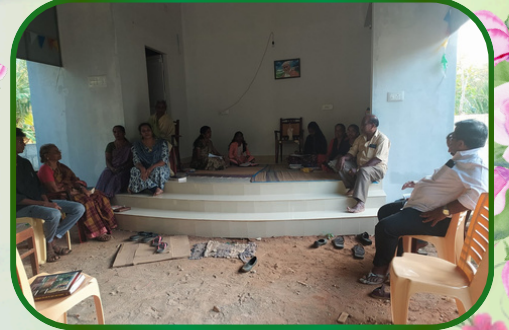
பள்ளியாடி அன்பியம் - 13