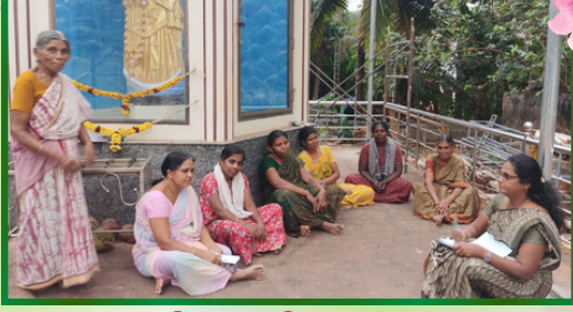
பிள்ளவிளை அன்பியம் 1