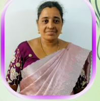
குழித்துறை அன்பியம் 7