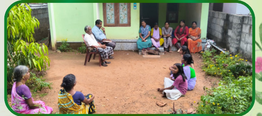
வேப்புவிளை அன்பியம் 4