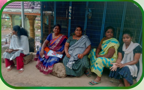
நெல்லிக்காவிளை அன்பியம் 2