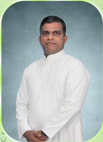
அருள்பணி. ஜீஸ் ரைமண்ட் புத்தன்கடை