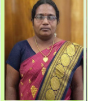
S. ஆன்றோ பென்சி