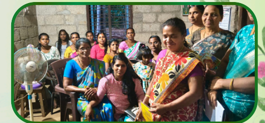
முஞ்சிறை அன்பியம் 1