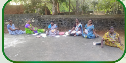
சேரிக்கடை அன்பியம் -3