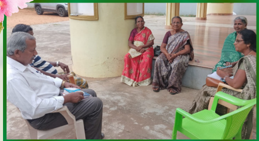
பிள்ளவிளை அன்பியம் 3