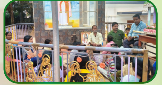
கரும்பிலாவிளை அன்பியம் 1