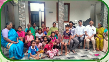
செட்டிச்சார்விளை அன்பியம் 11