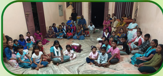
துண்டத்துவிளை அன்பியம் - 7