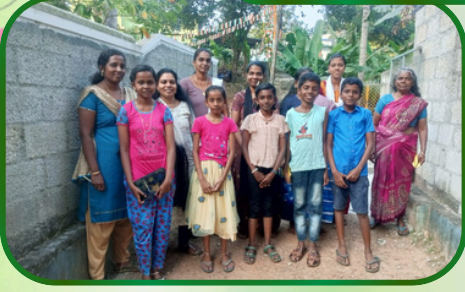
அமலாபுரம் அன்பியம் 5