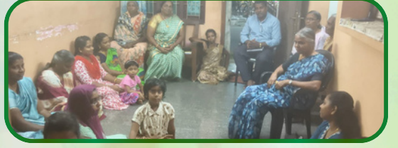
முஞ்சிறை அன்பியம் 13