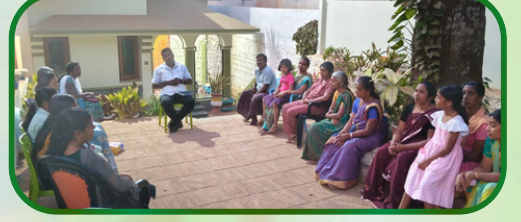
காப்புக்காடு அன்பியம் 1