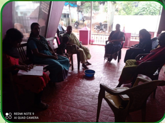
தெற்றிக்கோடு அன்பியம் - 3