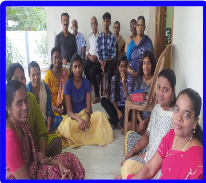
நல்லூர் அன்பியம் - 1