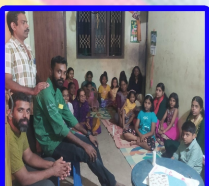
நல்லாயன்புரம் அன்பியம் - 2