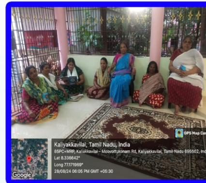
களியக்காவிளை அன்பியம் - 6