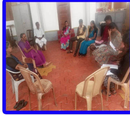
சாய்கோடு அன்பியம் 4