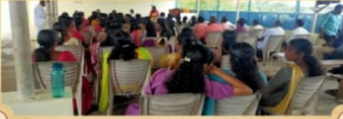
வேங்கோடு மறைவட்ட பொதுக்குழு கூட்டம்