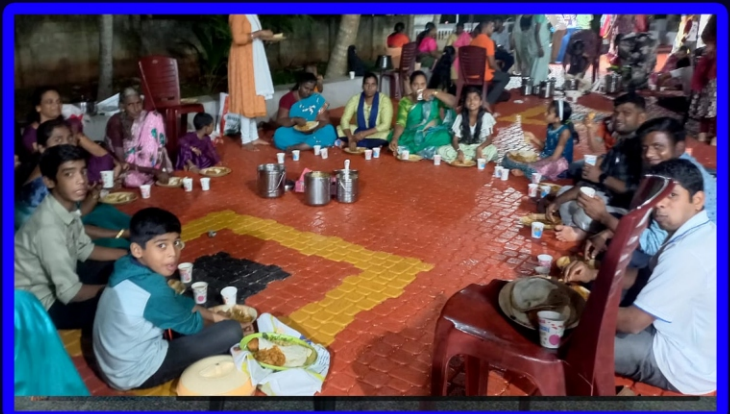
திருச்சி தூய பவுல் இறையியல் கல்லூரி குருத்துவ மாணவர்கள் பிலாவ- லினையில் உள்ள அன்பியங்கள் சந்திப்பு