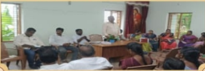
மாத்திரவிளை மறைவட்ட பொதுக்குழு கூட்டம்