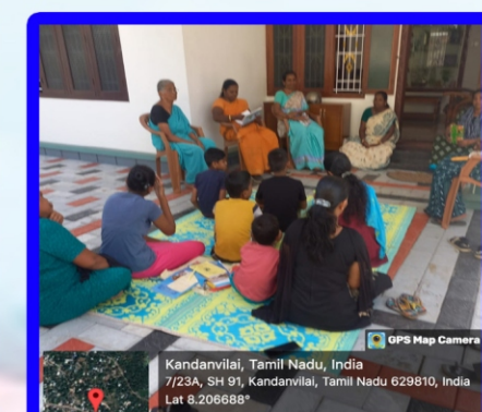
பாணையம் அன்பியம் - 3