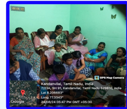
கண்டன்விளை அன்பியம் - 10