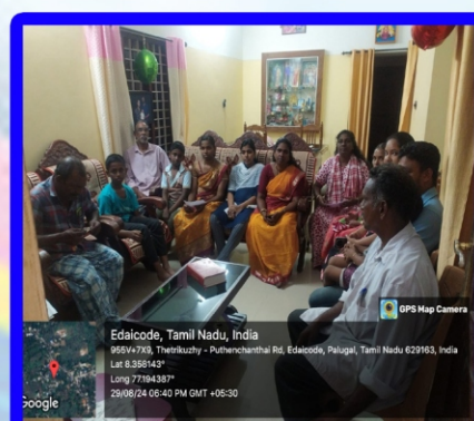
பர்க்குன்று அன்பியம் - 13