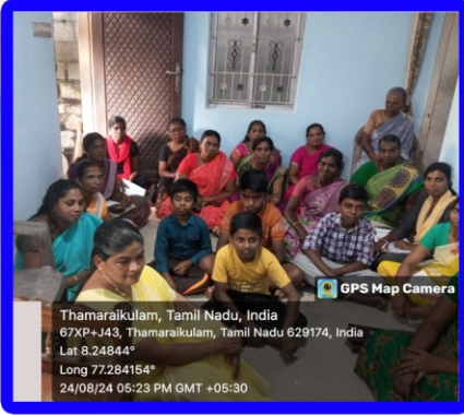
கோழிப்பேர்விளை, தூயபவுல் அன்பியம்