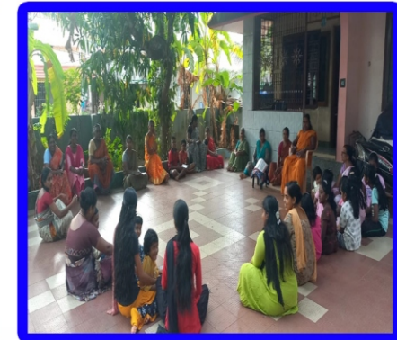
சேவிய்புரம் அன்பியம் - 4