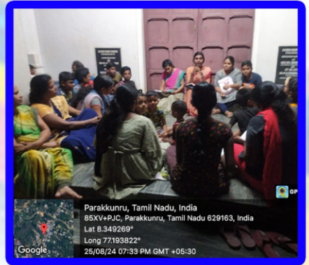
பர்க்குன்று அன்பியம் - 6