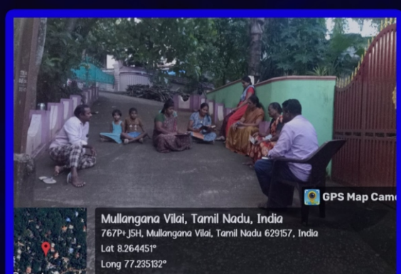
முள்ளங்கினாவினை அன்பியம் - 8