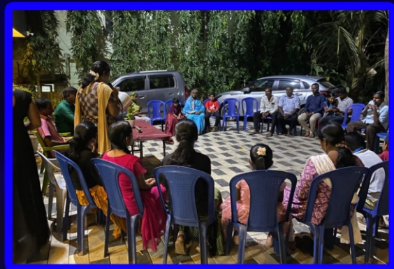
பாரதப்பள்ளி சிறப்பு அன்பியம்