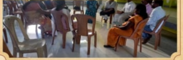
காரங்காடு மறைவட்ட செயற்குழு கூட்டம்