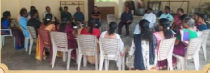
திரித்துவபுரம் மறைவட்ட செயற்குழு கூட்டம்