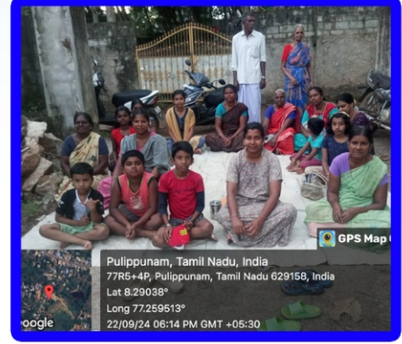
மஞ்சாடி அன்பியம் - 5