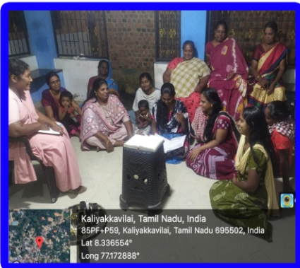
களியக்காவிளை அன்பியம் - 4