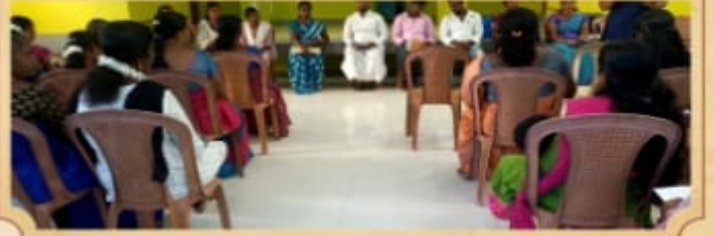
காரங்காடு மறைவட்ட பொதுக்குழு கூட்டம்