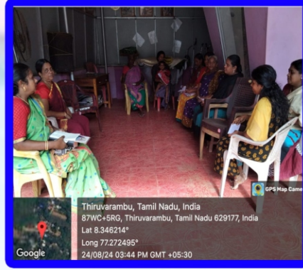
தெற்றிக்கோடு அன்பியம் - 1