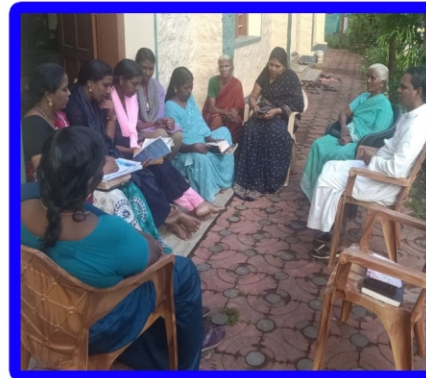
வருமான்குழி அன்பியம் - 4