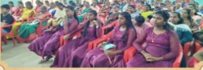
புத்தன்கடை மறைவட்ட செயல்தள பயிற்சி