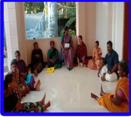
புதுக்கடை அன்பியம் - 1