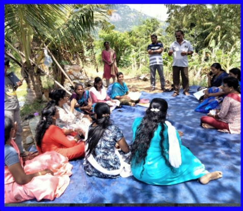
புத்தன்கடை சிறப்பு அன்பியம்