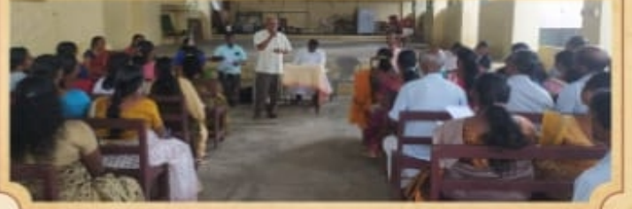
திரித்துவபுரம் மறைவட்ட பொதுக்குழு கூட்டம்